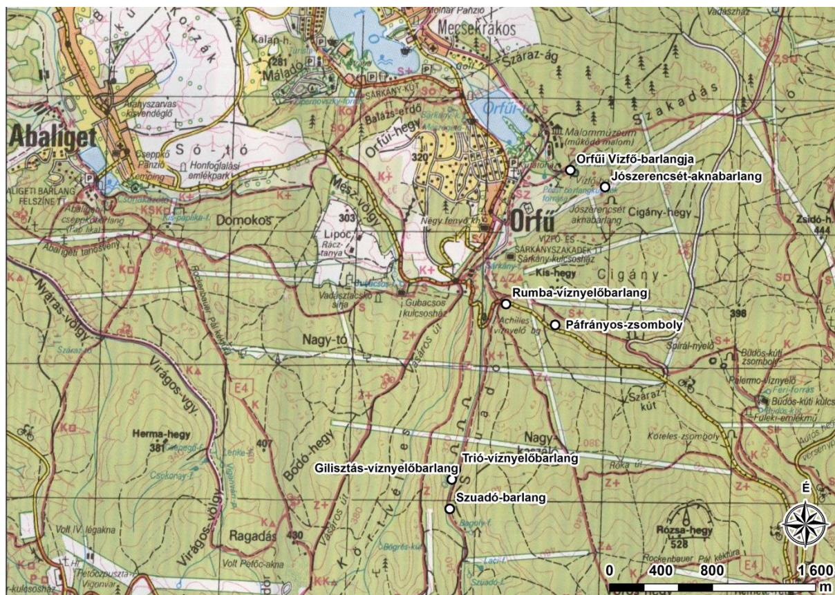
1. ábra. A 709-6/2012-es határozatban foglalt karsztobjektumok, melyre 2015-ben érvényes kutatási engedélye volt az Egyesületnek

Az engedélyt a Dél-dunántúli Környezetvédelmi, Természetvédelmi és Vízügyi Felügyelőség adta ki 709-6/2012 iktatószámú határozatával, melynek hatályát a 1833-6/2013 iktatószámú határozat 2017.12.31-re módosította. A Vízfő-forrásbarlangra a 1451-4/2014 iktatószámú Dél-dunántúli Környezetvédelmi, Természetvédelmi és Vízügyi Felügyelőségi határozat alapján feltáró kutatás és barlangi monitoring vizsgálati engedéllyel is rendelkezik az Egyesület.