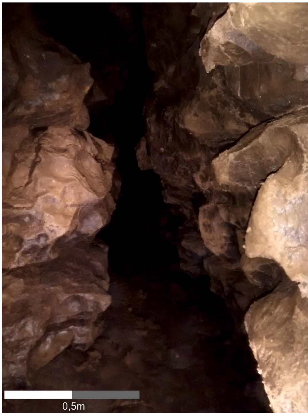
4. ábra. A Hármas akna mögötti hasadék újonnan feltárt szakasza