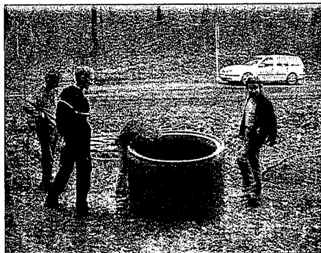
a kész lezárás