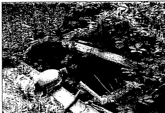
az ideiglenesen kiácsolt bejárat 2000-ben

A Remeteréti-völgyben nyíló barlangot 2000-ban tártuk fel 15 méter hosszúság, és 13 m mélységben. A barlang egykori víznyelő lehetett, amely az állandó vízfolyás megszűnte után eltömődött, majd valószínűleg szivárgó vizek és árvizek hatására újra megnyílt. A barlang lényegében egyetlen aknából áll, amely azonban kis méretei ellenére szép. A falakon több helyen függőcseppkövek és