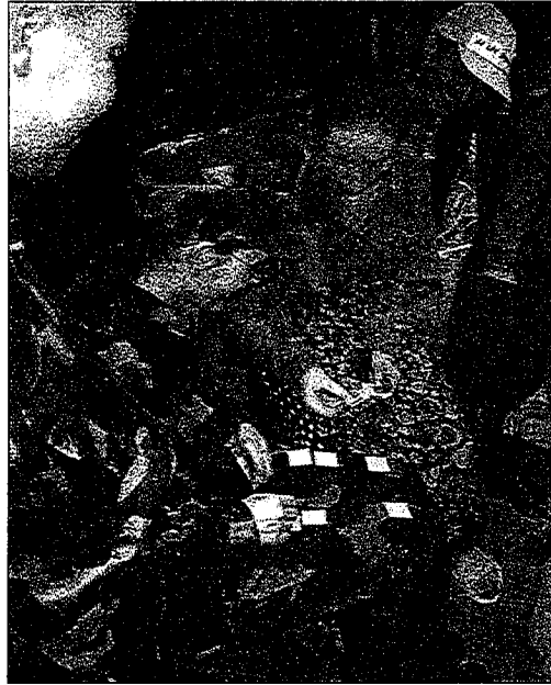
Vajon mit hoz a jövő a magyar NATO kontingensnek?

Miután minden megszavazandót megszavaztunk, eldöntendő eldöntöttünk, kezdődhetett a farsang! A lányok bevonultak a kisterembe, és minden fiút kiharancsoltak onnét. Nem tudtuk, mi készül, sejtettük persze, hogy valami meglepi, de a tippokról most itt inkább nem írunk...☺. Hosszú percek után aztán végre behívtak minket. A mosdó ajtót